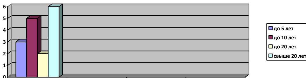
Диаграмма с характеристиками кадрового состава МБДОУ № 8:

Из 16 педагогических работников детского сада все соответствуют квалификационным требованиям профстандарта «Педагог». Их должностные инструкции соответствуют трудовым функциям, установленным профстандартом «Педагог».